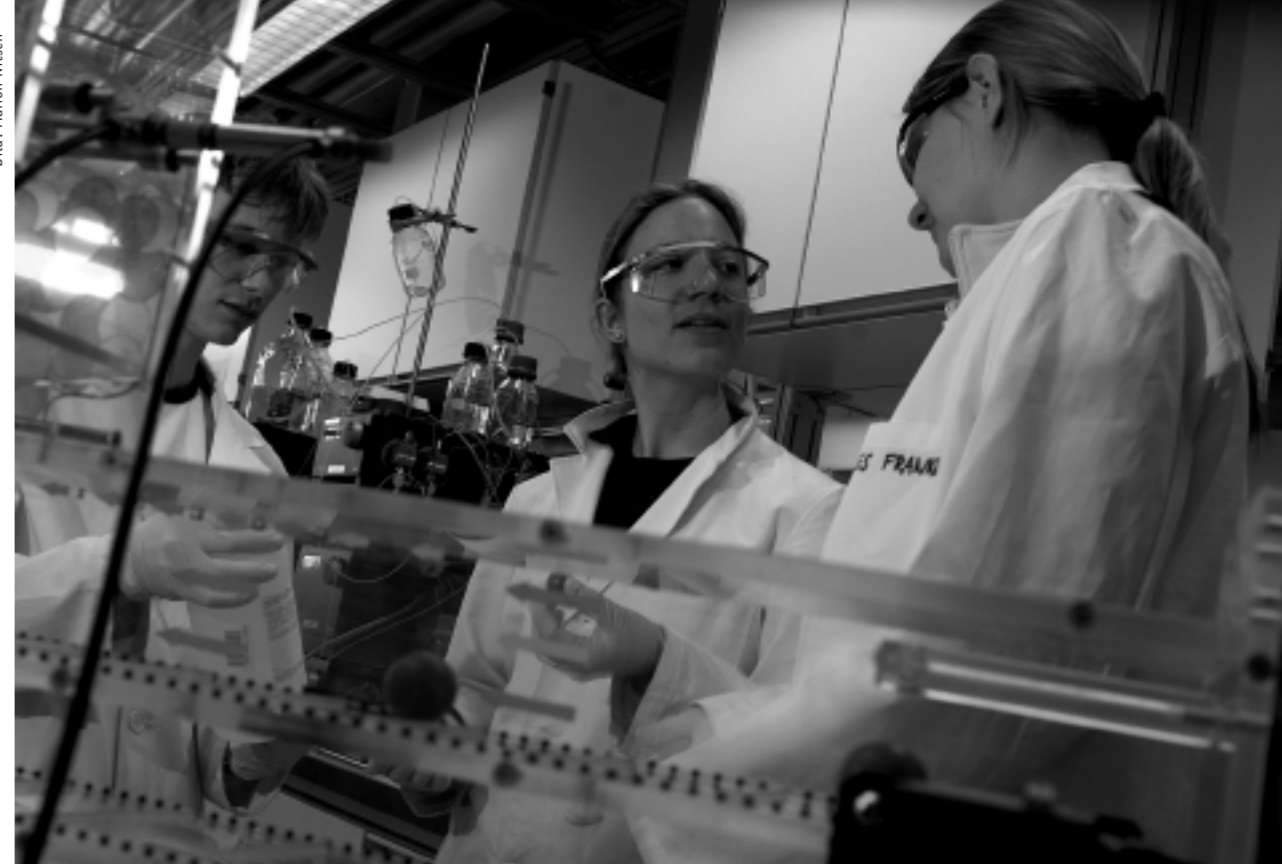
Labor ETH Zürich, 17. März, 10.14 Uhr

«Resonanzen» hat auch eine andere Musikfarbe, spielt auch Jazz und Weltmusik mit fließenden Übergängen zu politischen Themen. Der WDR hat für seine Musik eine eigene Software entwickelt, die nicht nach dem schmalen Rotationsprinzip der Popkanäle funktioniert. Vielmehr macht sie inzwischen 8500 Musikstücke zugänglich, die für die Sendungen eingesetzt werden können. Die Musikfarbe wird heute für Klassiksender zum Problem. Es hört nicht automatisch Opern oder Streichquartette, wer älter wird. Die heute ältere Generation ist mit Beatles und Stones aufgewachsen und stellt weiter ausgelegte musikalische Ansprüche. Jazz, etwas Weltmusik werden deshalb jetzt integriert. Ähnliches wie WDR3 versucht auf bestimmten Sendeplätzen auch Ö1, etwa beim nachmittäglichen «Spielraum»: «Es kommt dort alles vor, was Qualität hat in unseren Ohren und nicht Klassik ist», sagt Alfred Treiber, aber «Klassik bleibt die dominierende Musikrichtung.» Dagegen hat WDR5 als Wortprogramm das Problem, dass er bestimmt nicht wegen der Musik eingeschaltet wird, diese vielmehr bloss