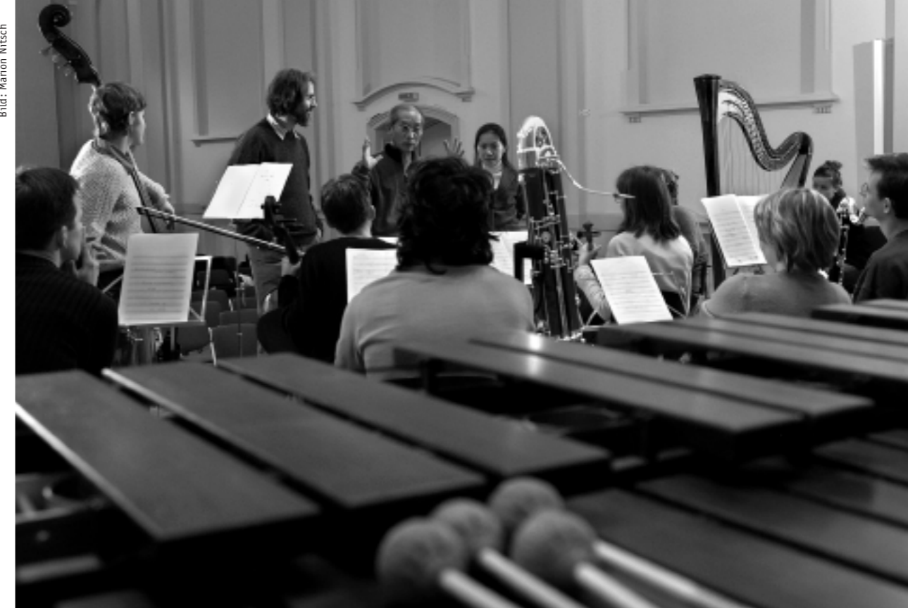
Musikhochschule Zürich, Orchesterprobe, 21. März, 10.31 Uhr

Wie können solche theoretischen Überlegungen umgesetzt werden: Schauspieler aus der Lebenswelt der Immigranten sollen als positiv besetzte Vorbilder fungieren. Es sollen Themen aus der Lebenswelt der jugendlichen Aussiedler aufgegriffen werden. Die gesellschaftlichen Milieus, die Lebensgeschichten aus der Migration sollen richtig recherchiert und differenziert dargestellt in die Fernsehgeschichte integriert werden. Solche Vorschläge macht die «Bundesinitiative Integration und Fernsehen». Es wäre falsch, solche Stoffe in explizite Multikulti-Stories und Integrations-Dramen zu verbannen. Interessanter ist der Einbau,