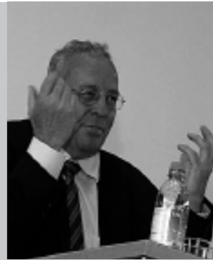
Titelbild: Lucia Annunziata im Interview mit Silvio Berlusconi (Sendung: IN 1/2 h auf RAI 3, 12. März 2006)