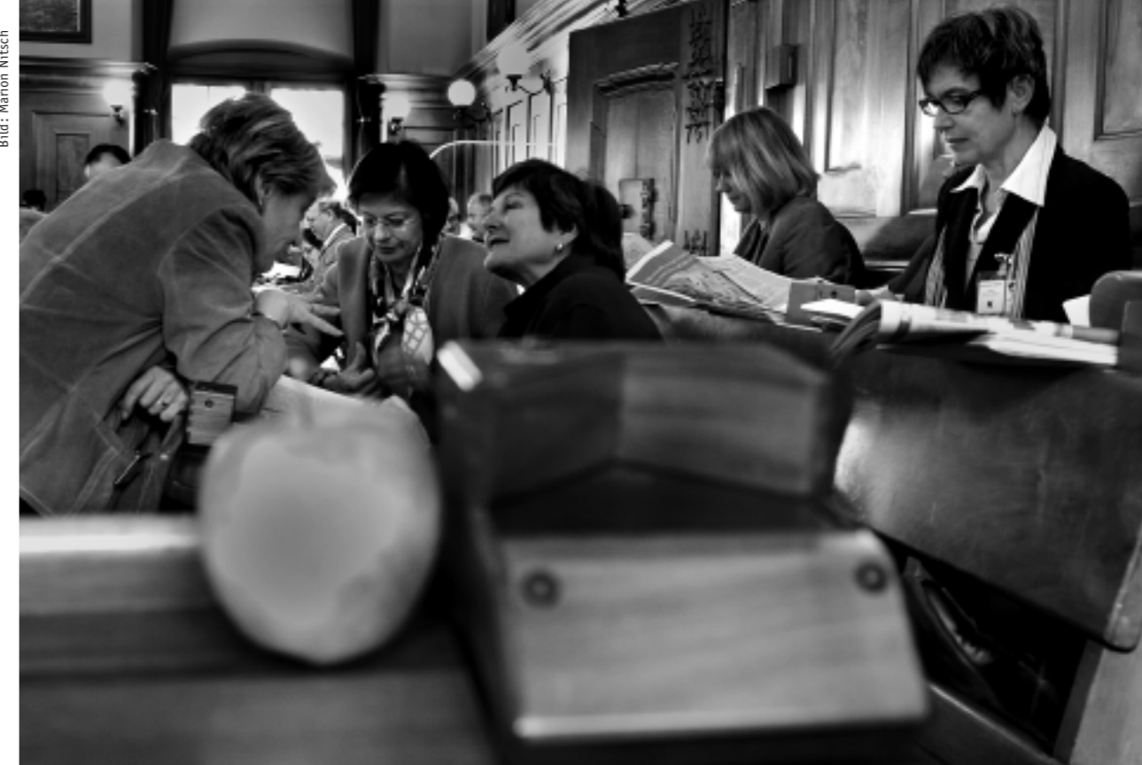
Rathaus Zürich, Kantonsrat, 20. März, 08.37 Uhr

Und noch ein Beispiel: Wir sind das einzige DRS-Programm mit einem tägli-